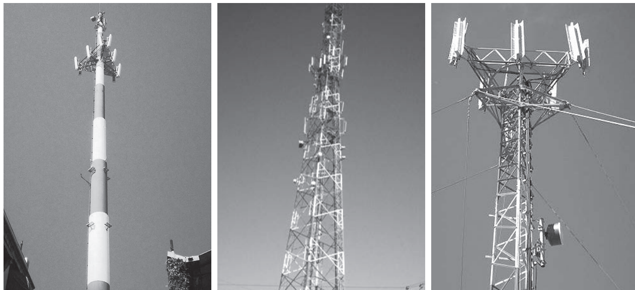
Figura 3. Monoposte (izquierda) torre autosoportada (centro) y torre arriostada (derecha)

El impacto electromagnético del sistema, que en general es la mayor preocupación de las personas expuestas, se evalúa por ingeniería de medición y se valora contrastando con los valores límites