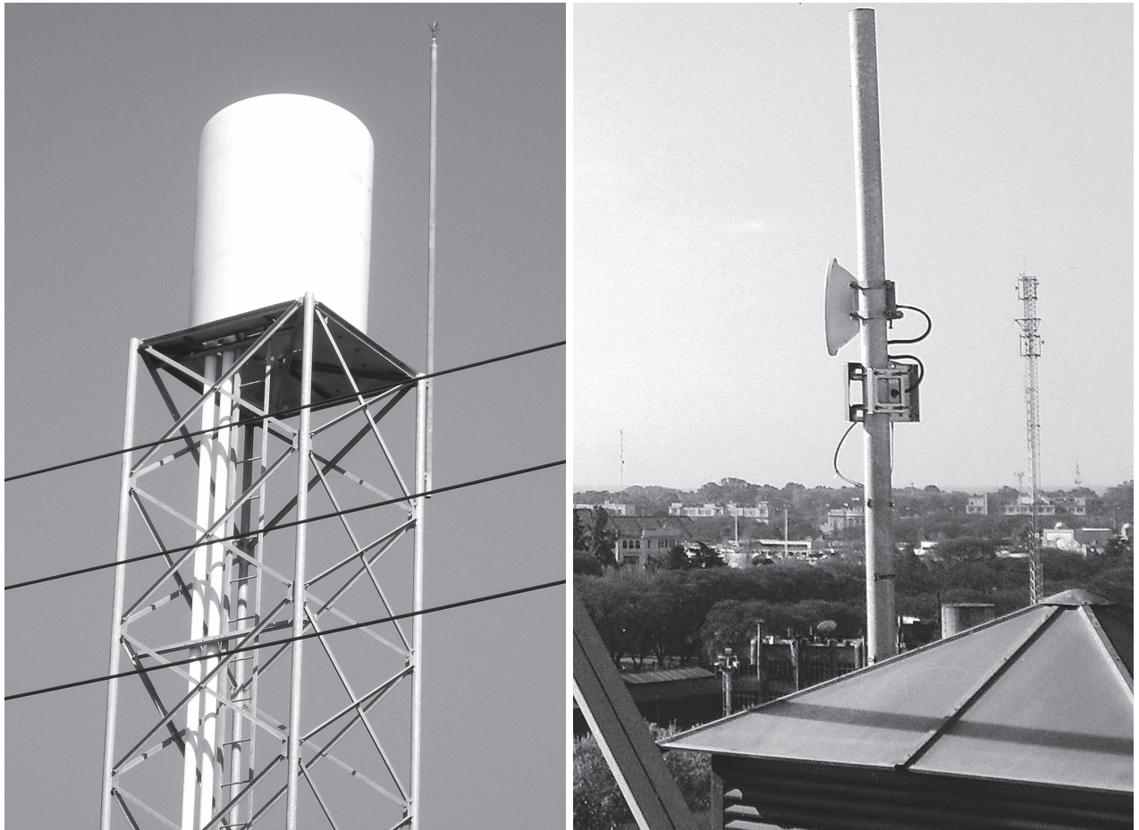
Figura 4. Antenas enmascaradas en tanque (izquierda) y en chimenea (derecha)

dictados por las normativas vigentes (Resolución Secretaría de Comunicaciones 530/2000 para público en general y Resolución MTESS 295/2003 para trabajadores). De la amplia experiencia que pudo acumularse hasta el momento, el impacto electromagnético de estos sistemas es bajo, es decir los valores de RNI medidos suelen estar en un orden de magnitud por debajo de los límites más estrictos, y es preciso aclarar que si bien estos valores dependen de la distancia a la antena emisora, también dependen de la potencia de emisión de la misma, y que es común encontrar estructuras grandes en tamaño pero con baja potencia emitida, por lo cual es preciso que los impactos se evalúen separadamente.